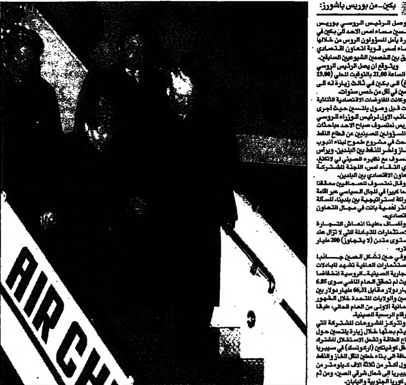
الروس يترحبون بيلتسن في مطار بكين (رويترز)

واشنطن، 9 نوفمبر (رويترز) - وصل الرئيس الروسي بيلتسن مساء أمس إلى بكين في ثالث زيارة له للصين خلال أقل من خمس سنوات. ويأتي هذا الزيارة في إطار سلسلة من اللقاءات التي يجريها بيلتسن مع المسؤولين الصينيين لتوطيد العلاقات الاقتصادية بين البلدين. وقال بيلتسن في بيان صحفي: «نحن نرحب بالفرصة التي يتيحها لنا هذا الزيار في تعزيز العلاقات الاقتصادية بين روسيا والصين». وأضاف: «نحن نعتقد أن هذا الإعلان يمثل خطوة مهمة نحو تحقيق السلام في كولومبيا». وقال وزير الخارجية الصيني تشن تشونغشوان في بيان صحفي: «نحن نرحب بالزيارة التي أجراها الرئيس الروسي بيلتسن إلى الصين». وأضاف: «نحن نعتقد أن هذا الإعلان يمثل خطوة مهمة نحو تحقيق السلام في كولومبيا».